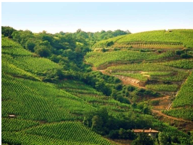
Vignobles à Ampuis