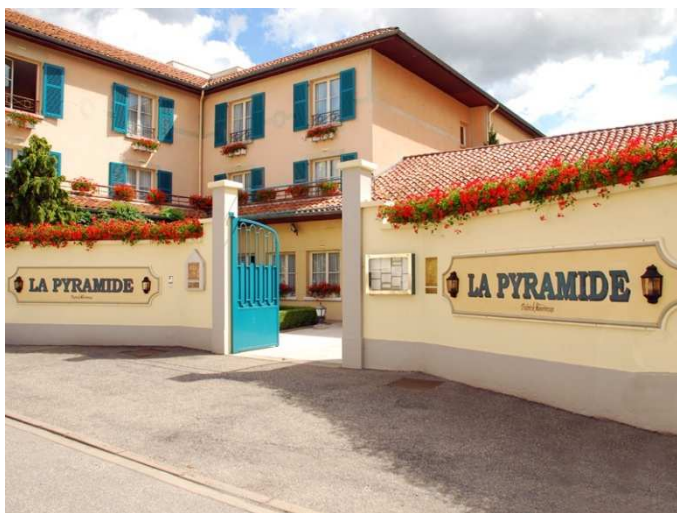
Restaurant La Pyramide - Photothèque OT Pays Viennois

Terludik , organisme spécialisé dans l'animation et le sport nature en Pays Viennois, propose une balade au cœur des vignes, sur les hauteurs d'Ampuis : promenade de 3 heures sur les sentiers empruntés au cours des saisons par les viticulteurs, pause casse-croûte à la manière des vigneron. Activité adaptable en fonction des attentes.