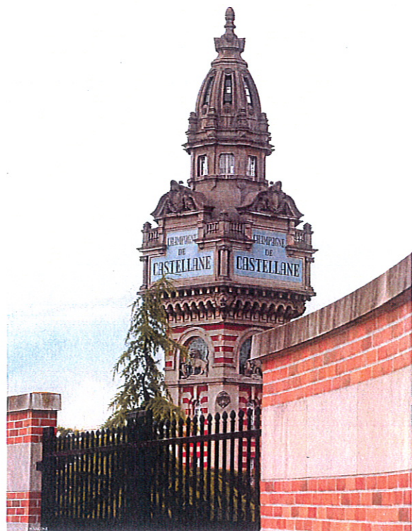
Tour du Champagne de Castellane