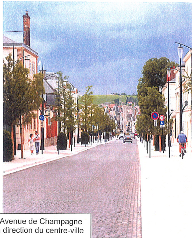
L'Avenue de Champagne en direction du centre-ville