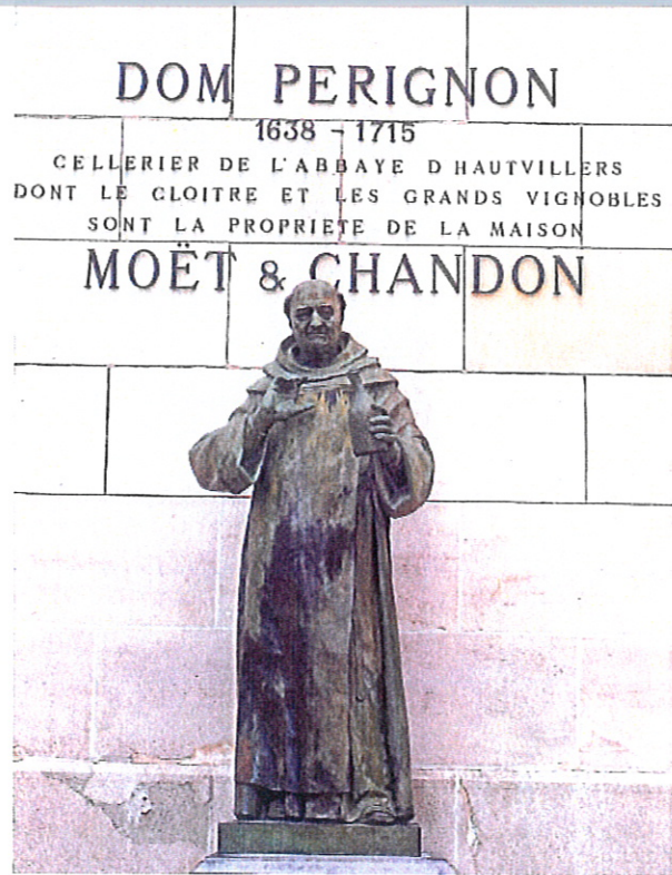
Statue de « l'inventeur » du vin pétillant (avenue de Champagne)