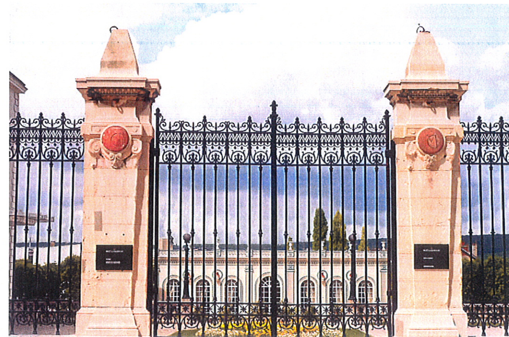
Avenue de Champagne, l'Orangerie de la Maison Moët et Chandon

Un chantier emblématique de l'embellissement urbain et de la revalorisation du patrimoine architectural à Epernay